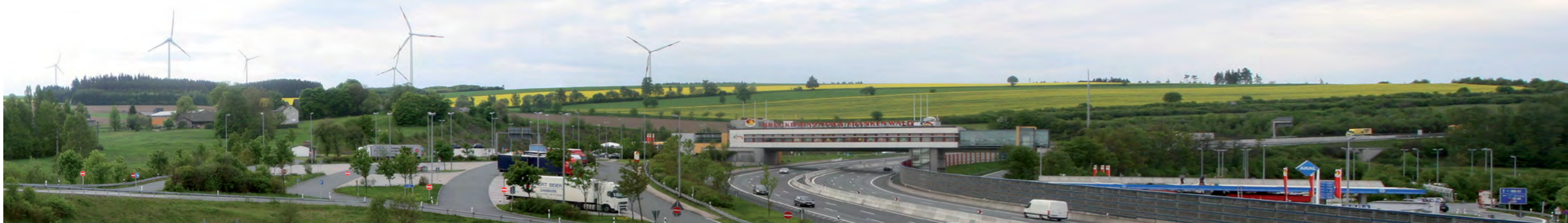
A 9 Tank- und Rastanlage Frankenwald