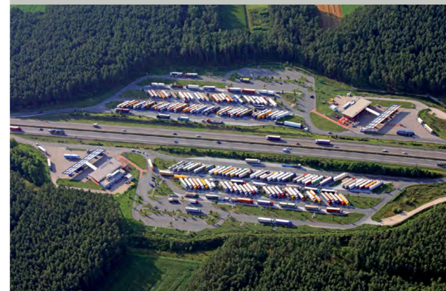
A 6 Tank- und Rastanlage Kammersteiner Land

Die Kosten trägt der Bund im Rahmen eines Sonderprogramms.