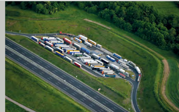
A 3 Parkplatz mit WC Röthenwald