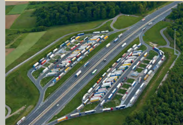
A 3 Parkplatz mit WC Fronberg